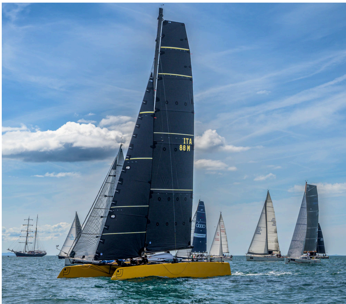
Partenza RAN 630 2025

L'ottava edizione della Regata dell'Accademia Navale - RAN 630 è puntualmente partita oggi, 27 aprile. Con vento da est-nord est di circa 12 nodi, alle ore 11,00 la flotta di 17 concorrenti è partita puntuale dalle acque antistanti Livorno. Ottimo start per Amapola II in centro linea, Tintorel in barca comitato e il catamarano foiling Falcon sulla boa di controstarter. Alla boa di disimpegno posizionata a 1 miglio è transitato in testa Falcon che ha subito accelerato al traverso mettendo la prua verso la Corsica, seguito da Amapola II e Lunatika, vincitrice delle ultime due edizioni.