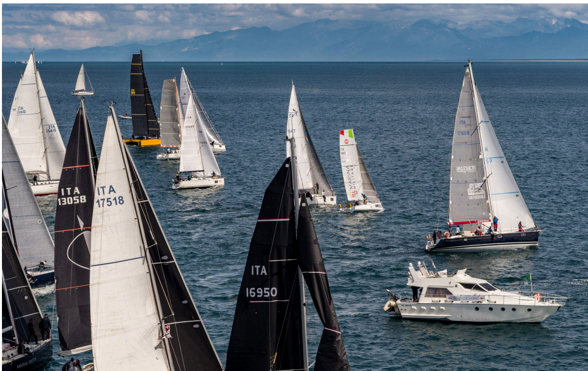
Partenza RAN 630 2025

Il primo yacht in tempo reale al cancello di Porto Cervo riceverà il Trofeo One Ocean messo in palio dallo Yacht Club Costa Smeralda. Fin dalla prima edizione della RAN 630, gli organizzatori hanno posto particolare attenzione alla necessità di tutelare e preservare il mare, sottoscrivendo i principi della Charta Smeralda di One Ocean Foundation.