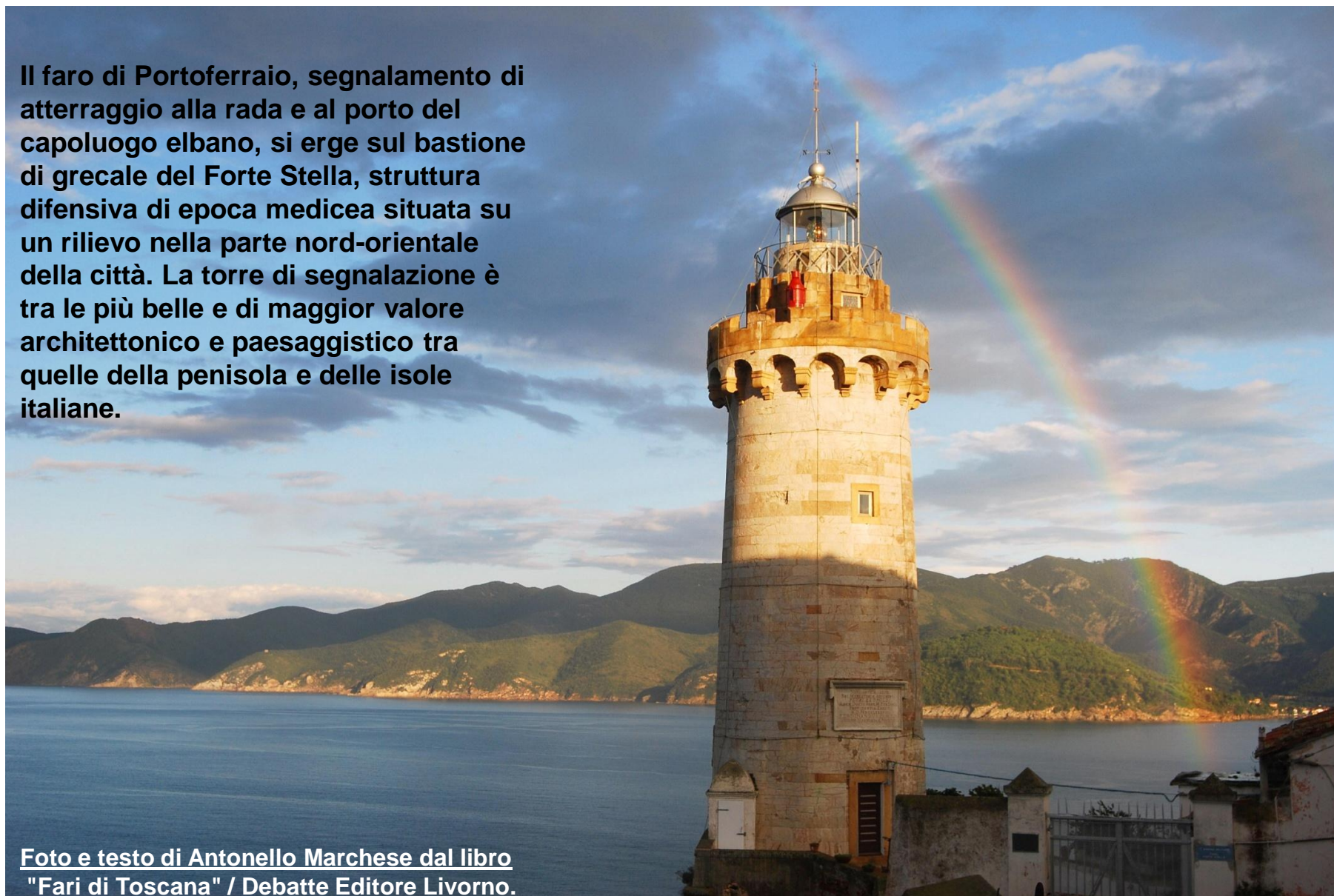
Foto e testo di Antonello Marchese dal libro "Fari di Toscana" / Debatte Editore Livorno.

Il faro di Portoferraio, segnalamento di atterraggio alla rada e al porto del capoluogo elbano, si erge sul bastione di grecale del Forte Stella, struttura difensiva di epoca medicea situata su un rilievo nella parte nord-orientale della città. La torre di segnalazione è tra le più belle e di maggior valore architettonico e paesaggistico tra quelle della penisola e delle isole italiane.